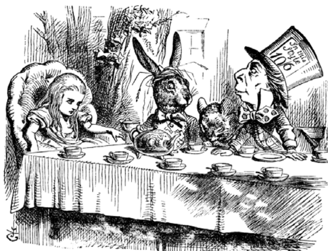
Ilustrație de John Tenniel (1820-1914) pentru Alice în Țara Minunilor de Lewis Carroll